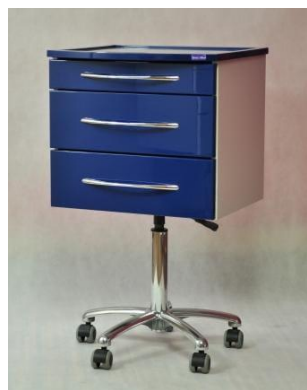
Asystor 3 szuflady