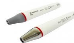
Skaler ultradźwiękowy woodpicker