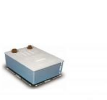
Separator RASCH 890