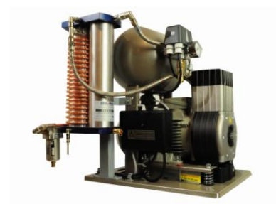
Kompresor Ekom DK 50 10 Z