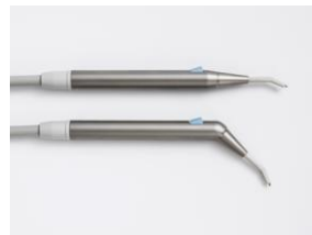
3 funkcyjna dmuchawka LUZZANI DENTAL