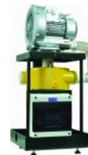
Ssak BRAVO 1

3 lata gwarancji na cały unit stomatologiczny