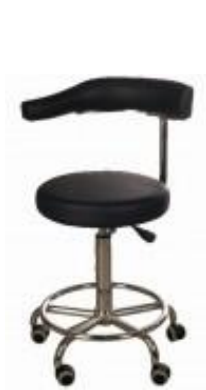
Krzeselko PRIM 2